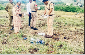
मुंह से निकल रहा था खून, दवा लेने की बात कहकर फैक्ट्री से वापस चला गया