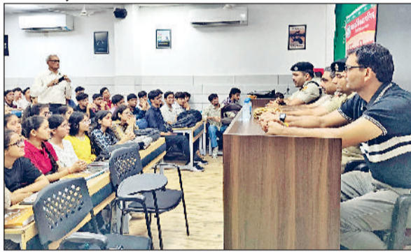
रोहतक। विद्यार्थियों को सम्बोधित करते पुलिस अधिकारी।

थाना पीजीआईएमएस की टीम ने केंद्रीय विद्यालय (दिल्ली बाईपास) एवं राजकीय सेकेंडरी स्कूल गांधी कैम्प में विद्यार्थियों को साइबर सुरक्षा संबंधी जानकारी दी। वहीं थाना शिवाजी कॉलोनी की टीम ने एचडी पब्लिक स्कूल बालंद में