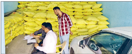
महम। खाद की दुकान में रिकॉर्ड की जांच करते हुए सीएम फ्लाइंग व वह दुकान जिस पर सीएम फ्लाइंग ने रेड की।