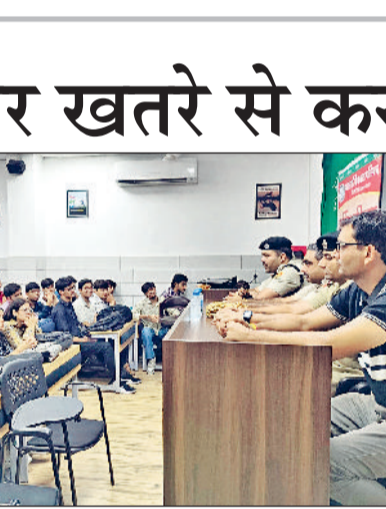
रोहतक। विद्यार्थियों को सम्बोधित करते पुलिस अधिकारी।

लगाभंग 25 से 30 दुकानदारों द्वारा किए गए अतिक्रमण को हटाया गया। निगम टीम ने यह भी पाया कि कई स्थानों पर दुकानदारों द्वारा अपने व्यापारिक सामान को फुटपाथ और सड़क के किनारे तक फैला दिया गया था, जिससे नागरिकों और वाहनों की आवाजाही बाधित हो रही थी। अभियान के दौरान कई रेहड़ी-पट्टरी संचालकों को चेतावनी दी गई कि वे भविष्य में फुटपाथ या सड़क पर कब्जा न करें। निगम अधिकारियों ने कहा कि अतिक्रमण के कारण न केवल यातायात व्यवस्था प्रभावित होती है बल्कि शहर की सुंदरता और स्वच्छता पर भी असर पड़ता है। निगम द्वारा यह अभियान नागरिकों की सुविधा और सार्वजनिक हित में चलाया जा रहा है। हालांकि सख्ती की वजह से दुकानदारों में भी रोष दिखाई दे रहा है।