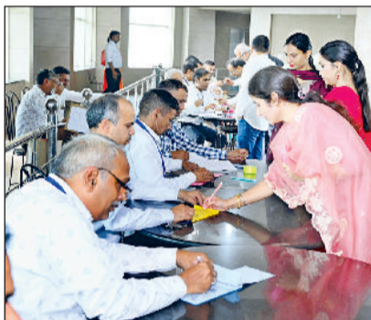
रोहतक। अपनी प्रर्ची लेते मतदाता व मतदान करते मतदाता।